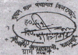
Photo Copy Attested

उक्त प्रपत्र उप जिलाधिकारी की अध्यक्षता में गठित समिति द्वारा प्राप्त कर प्रयोक्ता एजेन्सी को उपलब्ध कराया जायेगा।