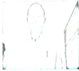
फट्टा लेने वाला