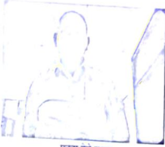
पट्टा देने वाला