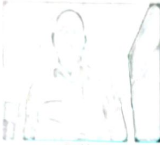
फट्टा देने वाला

Reg. No. 46 Reg. Year 2019-2020 Book No. 1