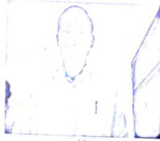
पट्टा लेने वाला