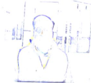
उप/सयुक्त पंजीयन अधिकारी