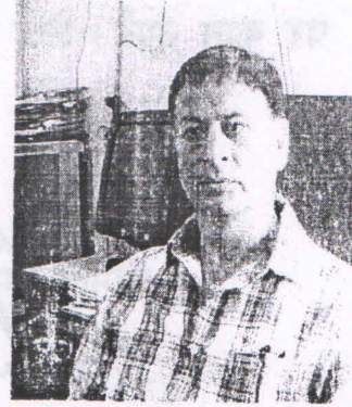
उप / सयुक्त पंजीयन अधिकारी