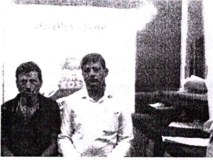
पट्टा देने वाला