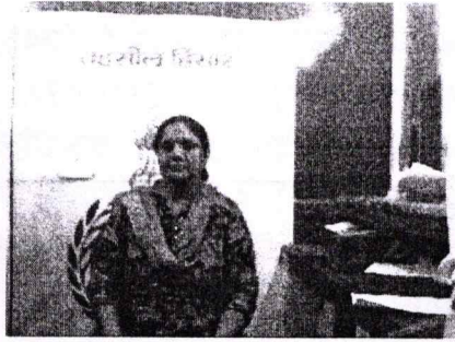
पट्टा लेने वाला