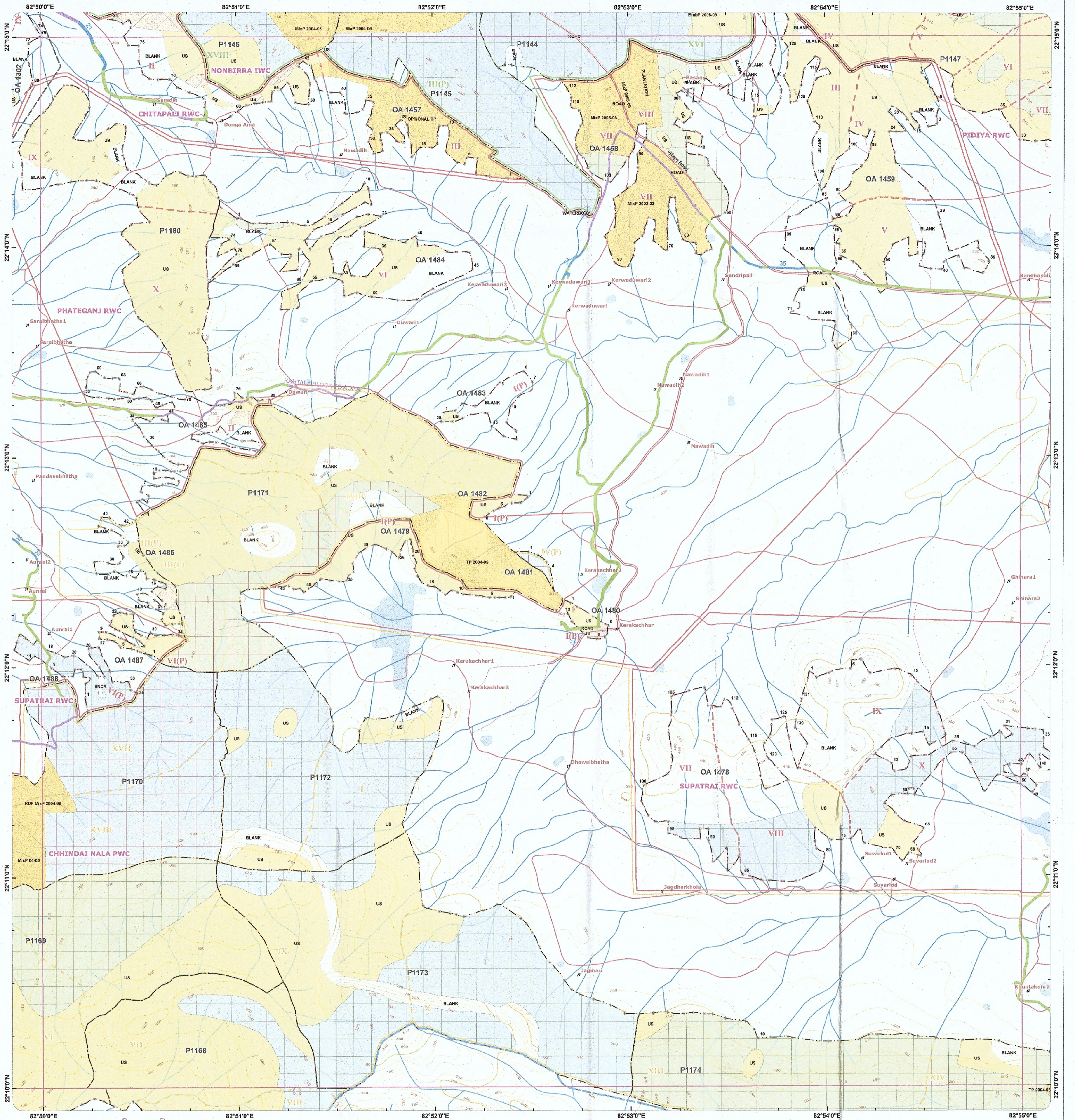
(वनस्पति मानचित्र 1:50,000)