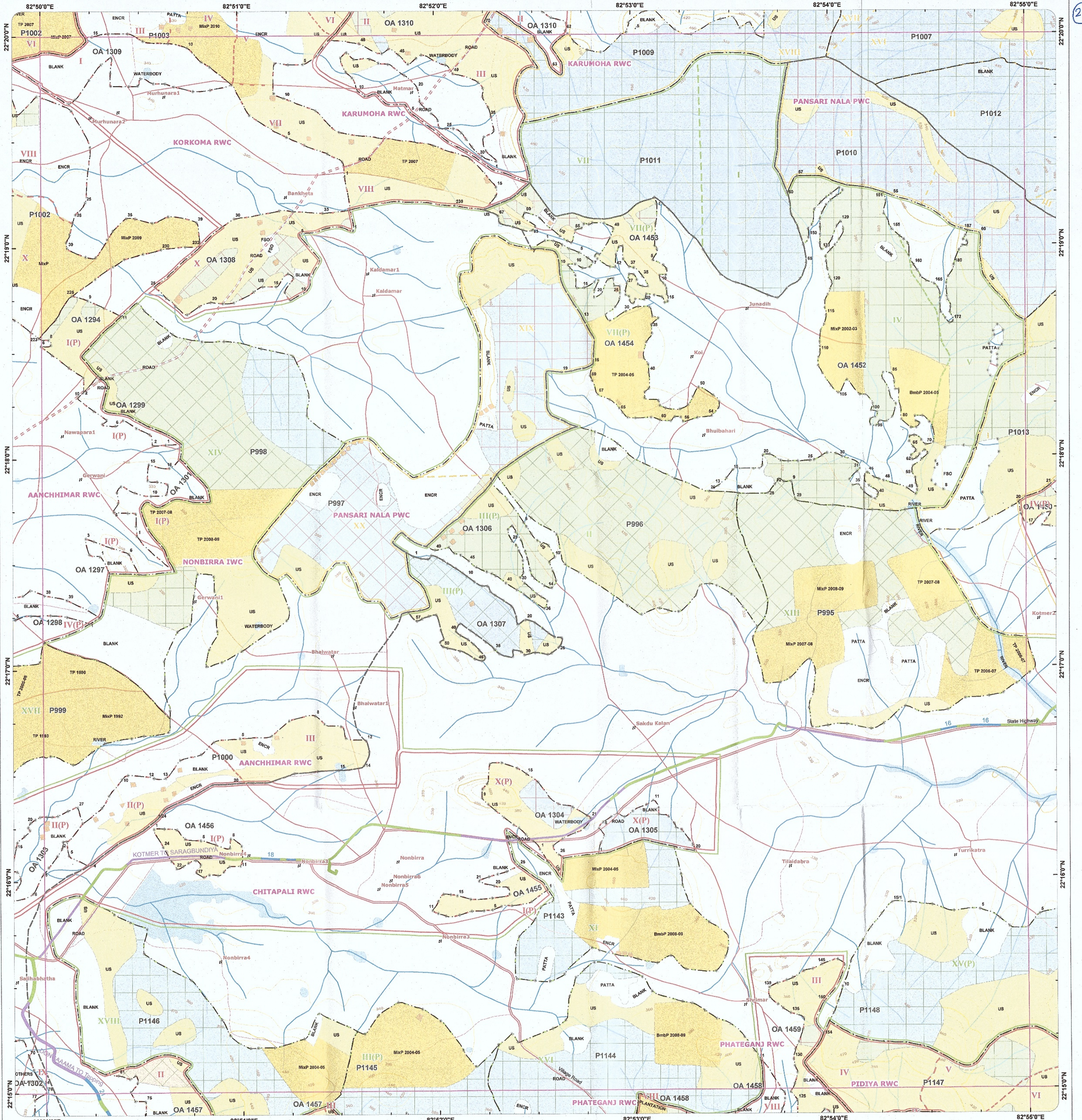
(वनस्पति मानचित्र 1:50,000)