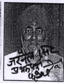
फोटो प्रथम पक्ष